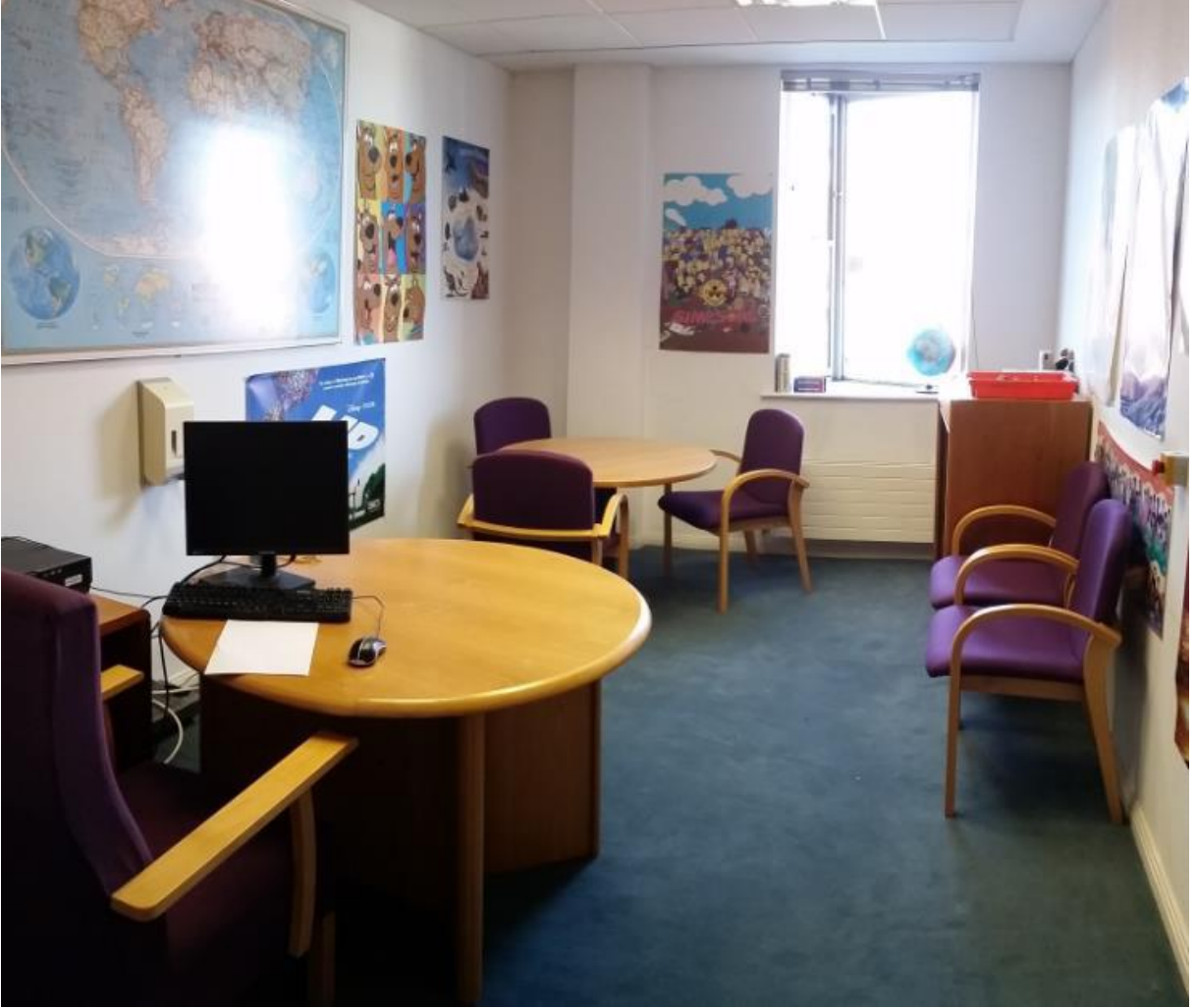
(غرفة المقابلة الرئيسية)

لقد تلقت مجموعة من المحاورين ذوي الخبرة في مكتب الحماية الدولية تدريبات إضافية خاصة تساعدكم في العمل على القضايا التي تشمل المتقدمين مثل (القاصرين غير المصحوبين بأولياء أمورهم أو المنفصلين عنهم). سيكون محاورك مدرباً بشكل خاص على إجراء المقابلات مع الأطفال تحت سن 18 سنة.