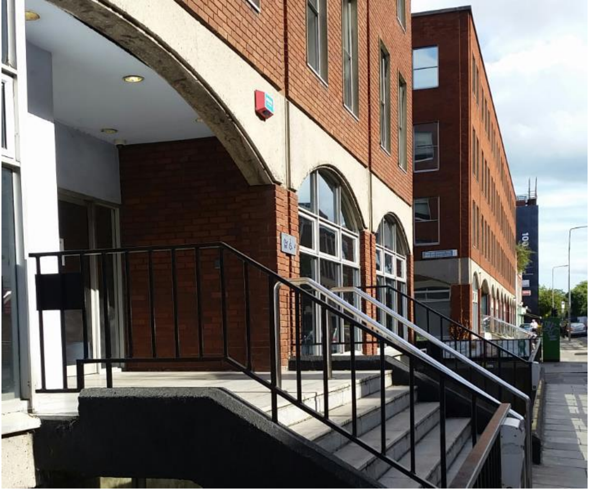
(المدخل الرئيسي لمكتب الحماية الدولية IPO)