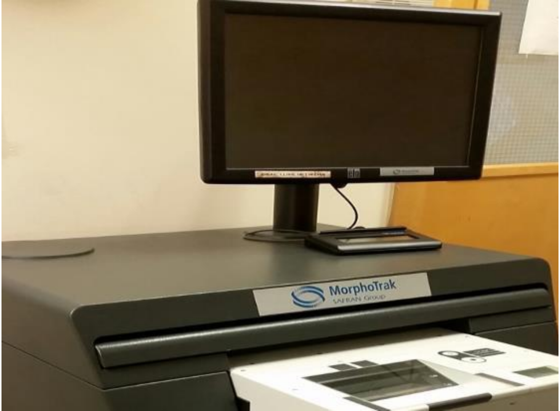
جهاز أخذ البصمات

تؤخذ البصمات عندما تضغط أصابعك على جهاز يقوم بقراءة البصمات.