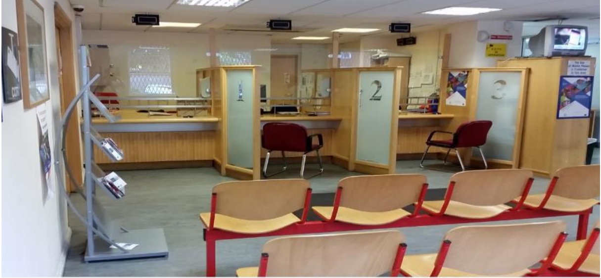
(مكان الاستقبال الرئيسي)

ستكشف المقابلة الأولية أيضا ما إذا كان بإمكان مكتب الحماية الدولي أن يأخذ طلب الحماية الخاص بك. وهذا ما يعرف بعملية القبول.