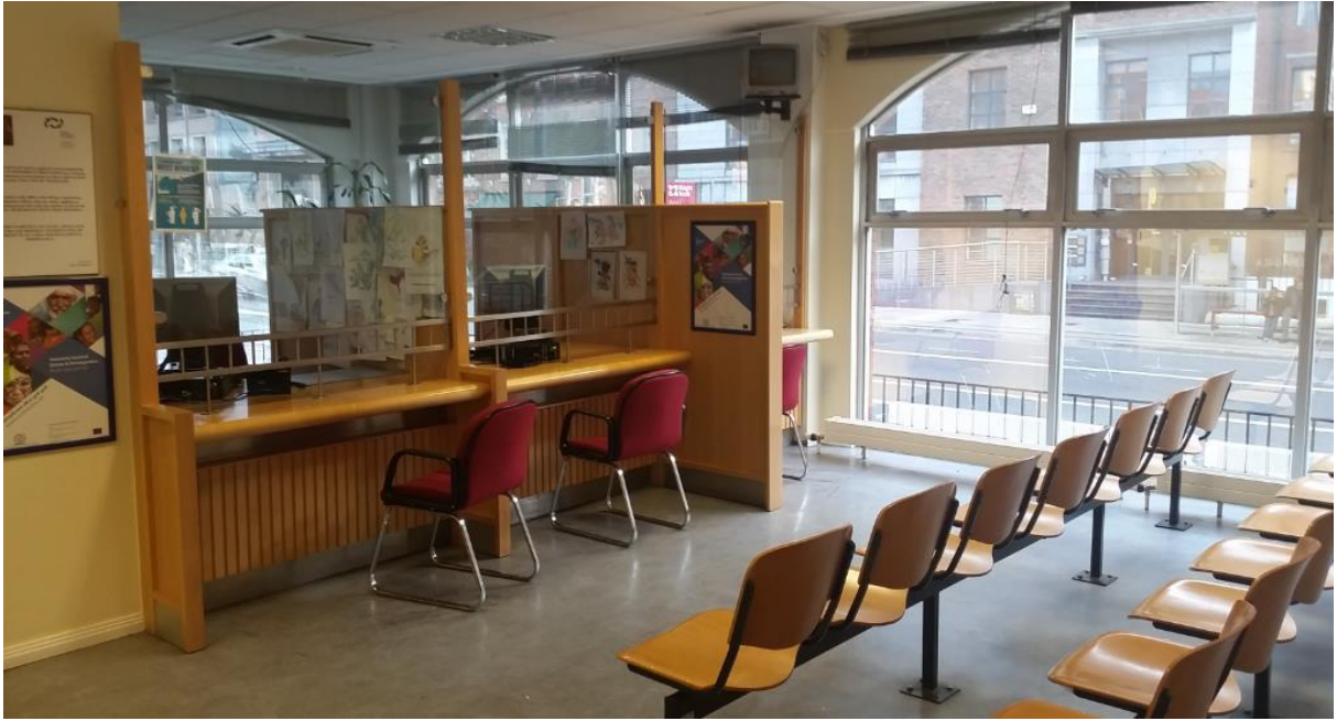
(مكان انتظار المقابلة)

نرجو منكم أن تتذكروا أنه يتوجب عليكم الإجابة على جميع الأسئلة بشكل كامل و صادق لكي يتسنى لنا الحصول على أفضل المعلومات الممكنة و المتاحة.